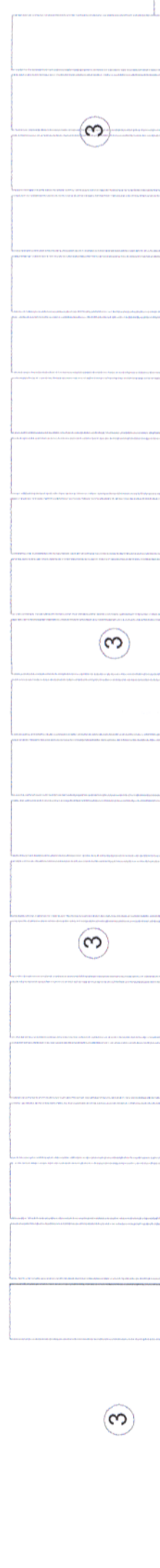
Gard din placi prefabricate